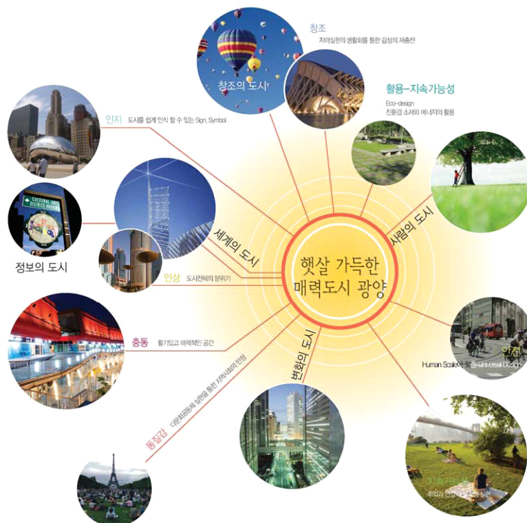
( 그림 III- 36 ) 광양시 경관 미래상