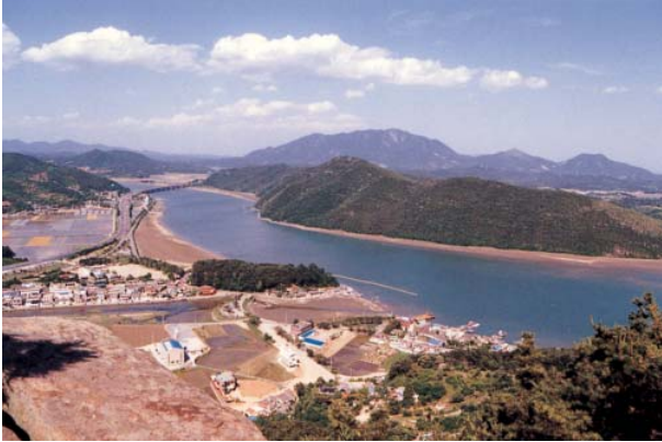
사진2-86 : 섬진강 (하구)