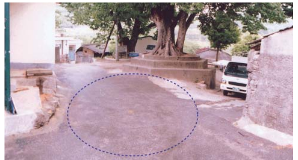
사진2-88 : 옛 섬거역터