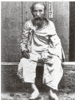
사진2-83 : 동학의 2대교주 최시형

하지만 1864년 최제우의 죽음으로 다소 위축되었다가 1880년대 말부터 전북지역을 중심으로 확산되어 간 것으로 추정된다. 동학의 2대 교주인 최시형(崔時亨)이 전주와 삼례(參禮) 등지를 순회하던 시기와 전북출신 동학교도가 최시형을 면담한 시기가 80년대 말에서 90년대 초에 이루어졌다는 점에서 그러하다. 훗날 전봉준과 김개남 등과 같은 동학농민혁명의 주요 지도자들이 대부분 이 시기에 동학에 입교하였다는 사실도 주목할 만하다. 다시 말해, 1860년대 초와 1880년대 말을 전후한 시기에 동학은 전북지역을 중심으로 수용·확산되었다.