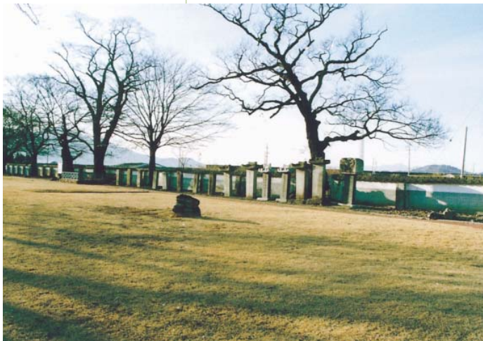
사진2-87 : 동학농민 포살지인 광양읍 유당공원

보이지 않지만 김인배의 9촌 숙부인 현익(顯翼 : 1867~1895)도 광양에서 죽었다고 한다. 81) 따라서 얼마나 많은 농민군이 광양에서 죽어갔는지 정확히 알 수 없다.