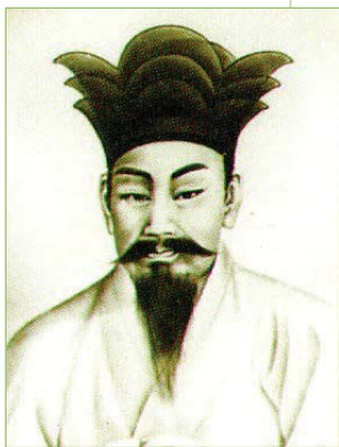
사진2-82 : 동학의 창시자 최제우

서 소외당한 평민과 천민들에게 만인평등의 사상과 근대적 인간으로서의 자각을 가지게 함으로써 인간의 기본권을 인정하였다. 2)