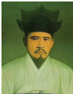
사진2-84 : 동학농민군 총대장 전봉준

전봉준의 격문은 즉시 순천을 비롯한 전남 동부지역에 전달되었던 것 같다. 순천지역에서는 백산봉기에 박낙양(朴洛陽)이 두령으로 참여한 것으로 보아 그러하다. 8) 박낙양은 전봉준의 주장에 적극 찬성하였기 때문에 순천의 농민군을 모아 백산으로 달려갔을 것이다. 이들은 전봉준의 지휘를 받